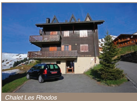
Chalet Les Rhodos